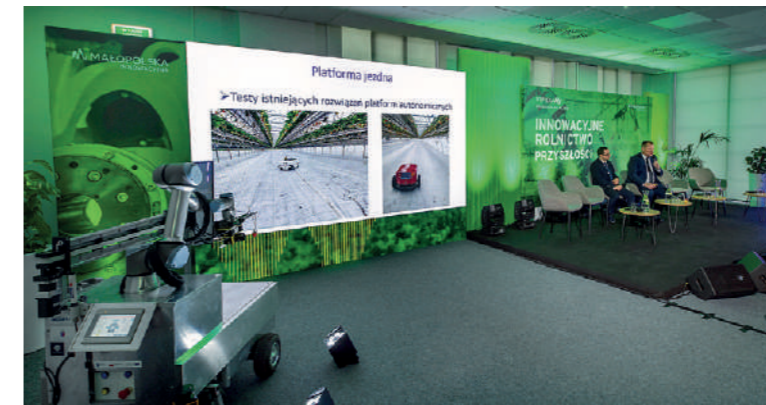
Jagobot – automatyczny robot do zbioru truskawek

Wydarzenie rozpoczęło się od prezentacji Jagobota – automatycznego robota do zbioru truskawek stworzonego na Uniwersytecie Rolniczym w Krakowie. Koniecznością współczesnego rolnictwa jest cyfryzacja, wdrażanie nowych technologii i robotyzacja ciężkich oraz uciążliwych prac. Tylko to zapewni konkurencyjność oraz umożliwi zatrzymanie młodego pokolenia na wsi. To jedne z wielu przesłań płynących z panelu dyskusyjnego poświęconego