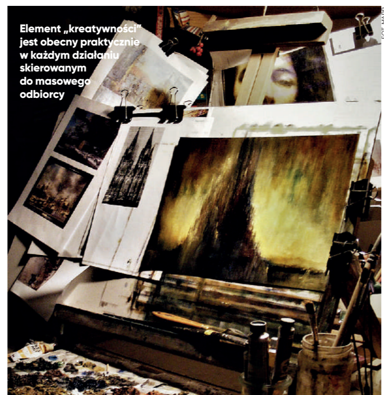
Element „kreatywności” jest obecny praktycznie w każdym działaniu skierowanym do masowego odbiorcy

Zbitka frazeologiczna przemysł kreatywny, podobnie jak na przykład przemysł czasu wolnego i przemysł kulturowy, sugeruje, że do zjawisk o nieostrych konturach, opierających się na trudnych do zidentyfikowania przesłankach, można zastosować praktykę przedsiębiorstwa, reguły rynku z jego popytem i podażą, z inflacją i deflacją, konkurencyjnością, bankructwem i stopą zysku. Rodzi się pytanie, czy to akrobaci kreatywności wraz z posłańcami kultury tęsknią za industrializacją, która ma dać trwałe podstawy ich działań, czy też to menedżerowie i praktycy dużych i małych przedsiębiorstw