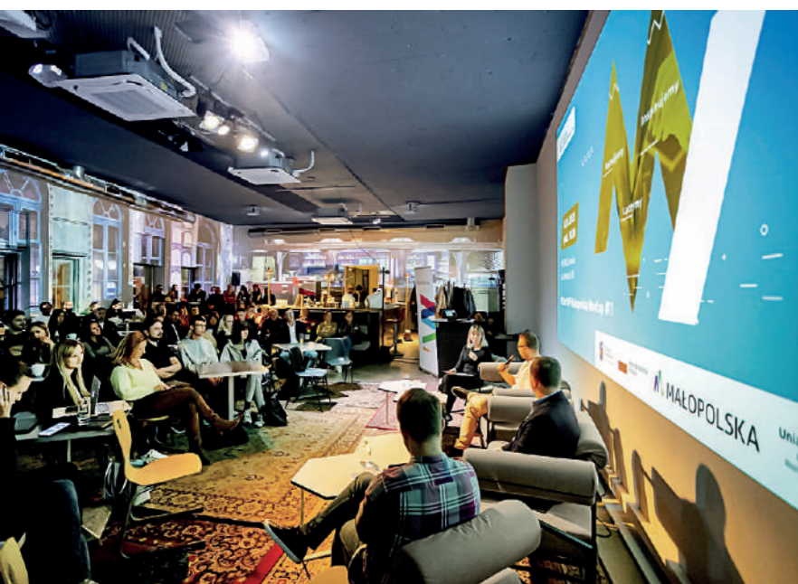
Przy kawie o innowacjach