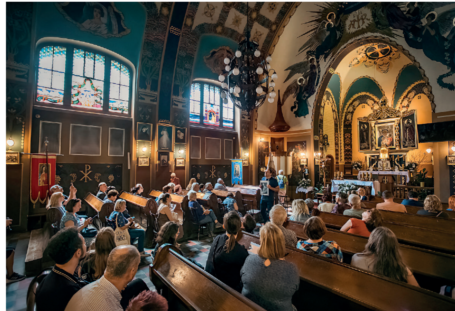
Uczestnicy 26. Małopolskich Dni Dziedzictwa Kulturowego we wnętrzu kaplicy w Kobierzynie