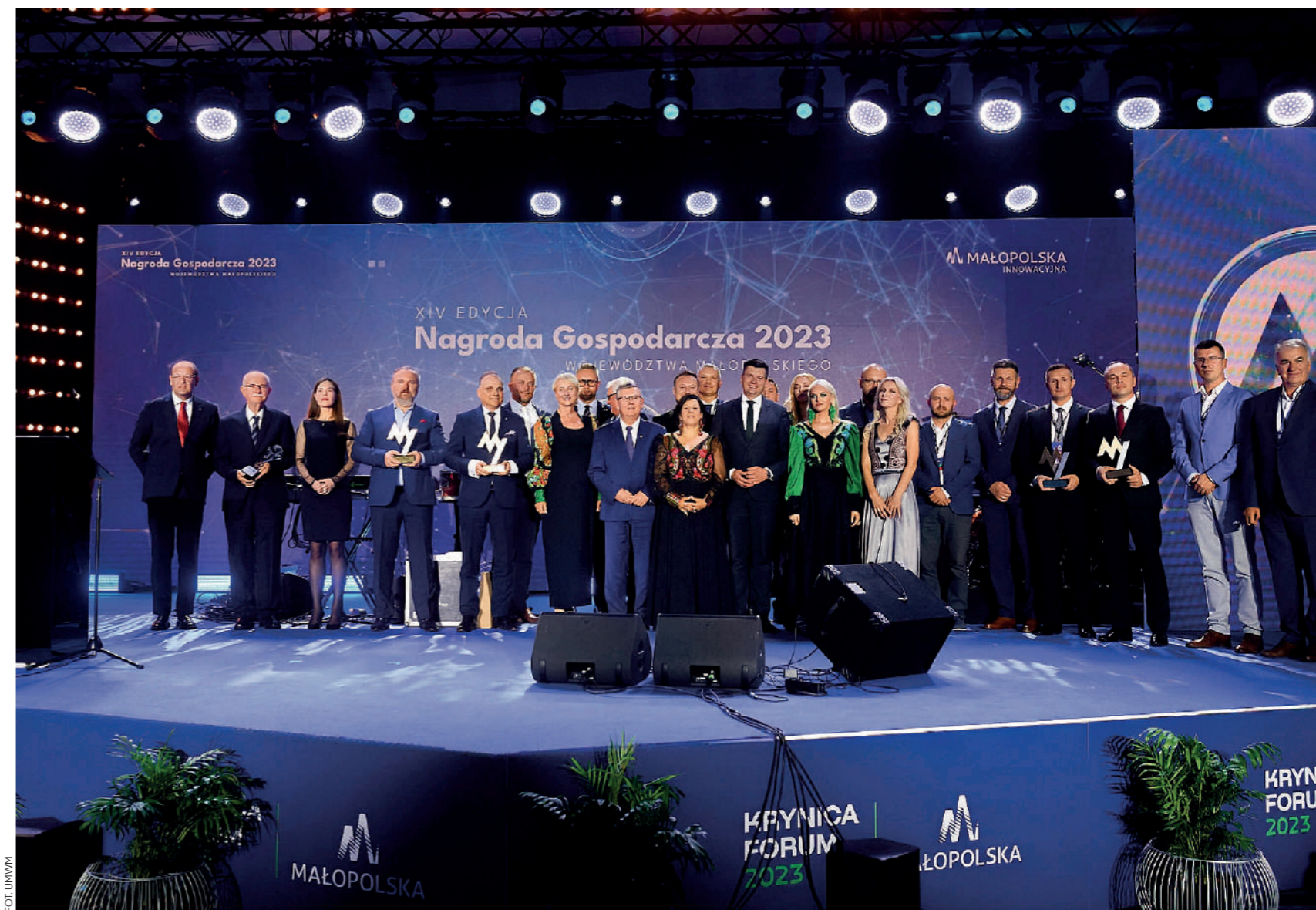
Gala Nagrody Gospodarczej 2023 Województwa Małopolskiego

Staramy się również docenić trud przedsiębiorców i nagrodzić najlepsze firmy, dlatego ustanowiliśmy Nagrodę Gospodarczą Województwa Małopolskiego. Jej celem jest promowanie najlepszych przedsiębiorców z Małopolski oraz inspirowanie ich rozwoju, promowanie postaw proinwestycyjnych i konkretnych dokonań innowacyjnych oraz zwiększenie konkurencyjności między przedsiębiorcami. Nagroda przyznawana jest – od 2009 roku w kategoriach: mikroprzedsiębiorca, mały przedsiębiorca, średni przedsiębiorca, duży przedsiębiorca. Jeszcze raz podkreślam, że rozwój innowacyjności w przedsiębiorstwach to nie puste słowa, ale konkretne przykłady, jak np. firma Amplus, która zautomatyzowała proces zbierania truskawek i wprowadziła ich bezglebową uprawę, czy firma Protech, której poziom robotyzacji jest wzorcowy w skali kraju i wynosi 571 robotów na 10 000 pracowników przy średniej 71 robotów dla Polski. Takich przykładów jest wiele i jest to dowód na to, że małopolscy przedsiębiorcy mają się dobrze, są kreatywni i idą za nowymi trendami gospodarczymi. To właśnie oni są naszą wizytówką i jako samorząd jesteśmy z tego dumni.