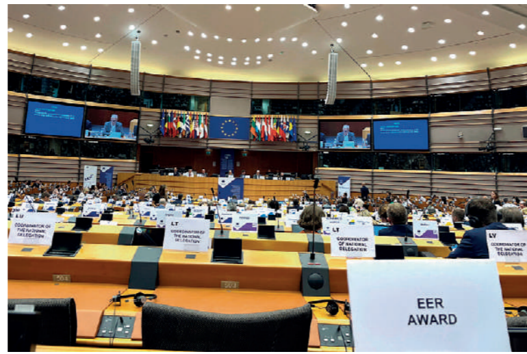
Tytuł ERP otrzymują regiony, które posiadają przyszłościowe wizje rozwoju i wspierania przedsiębiorczości oraz efektywnie wydatkują środki publiczne

Działaniom opisanym w małopolskiej strategii do konkursu ERP przyświeca hasło „Odpowiedzialna przyszłość”. Odzwierciedla ono najważniejsze wartości, które od lat towarzyszą inicjatywom podejmowanym w regionie. Po pierwsze jest to rozwój zrównoważony, wykorzystujący lokalny potencjał i możliwości, ale jednocześnie zakładający aktywne wdrażanie nowoczesnych rozwiązań i czerpanie z międzynarodowych doświadczeń. Po drugie to zdolność do dynamicznego działania, szczególnie w obliczu wyzwań. Tutaj doskonałym przykładem jest chociażby Małopolska Tarcza Antykrzyzysowa uruchomiona przez województwo, w ramach której przeznaczono ok. 2,3 mld zł, by walczyć z pandemią COVID-19 i złagodzić jej skutki dla gospodarki.