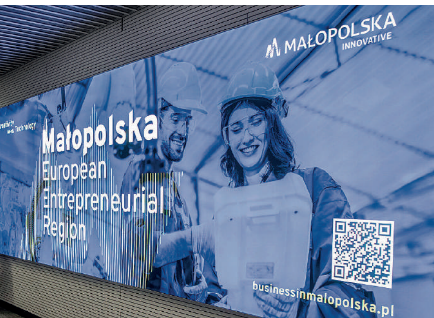
Małopolska Europejskim Regionem Przedsiębiorczości 2024