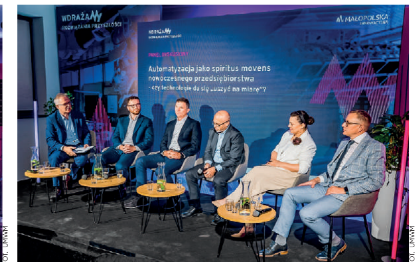
Dyskutowano też o nowoczesnych technologiach, które są nieuniknionym kierunkiem transformacji współczesnych, nowoczesnych przedsiębiorstw

https://www.malopolska.pl/aktualnosci/biznes-i-gospodarka/automatyzacja-i-cyfryzacja-to-przyszlosc