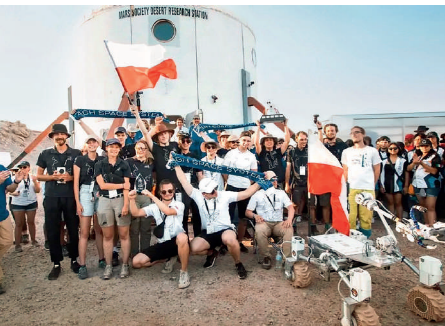
Małopolska drużyna AGH Space Systems

– Skoro temat funduszy europejskich został przywołany przez Pana proszę powiedzieć, jak wygląda struktura funduszy europejskich w Małopolsce w aktualnej perspektywie finansowej?