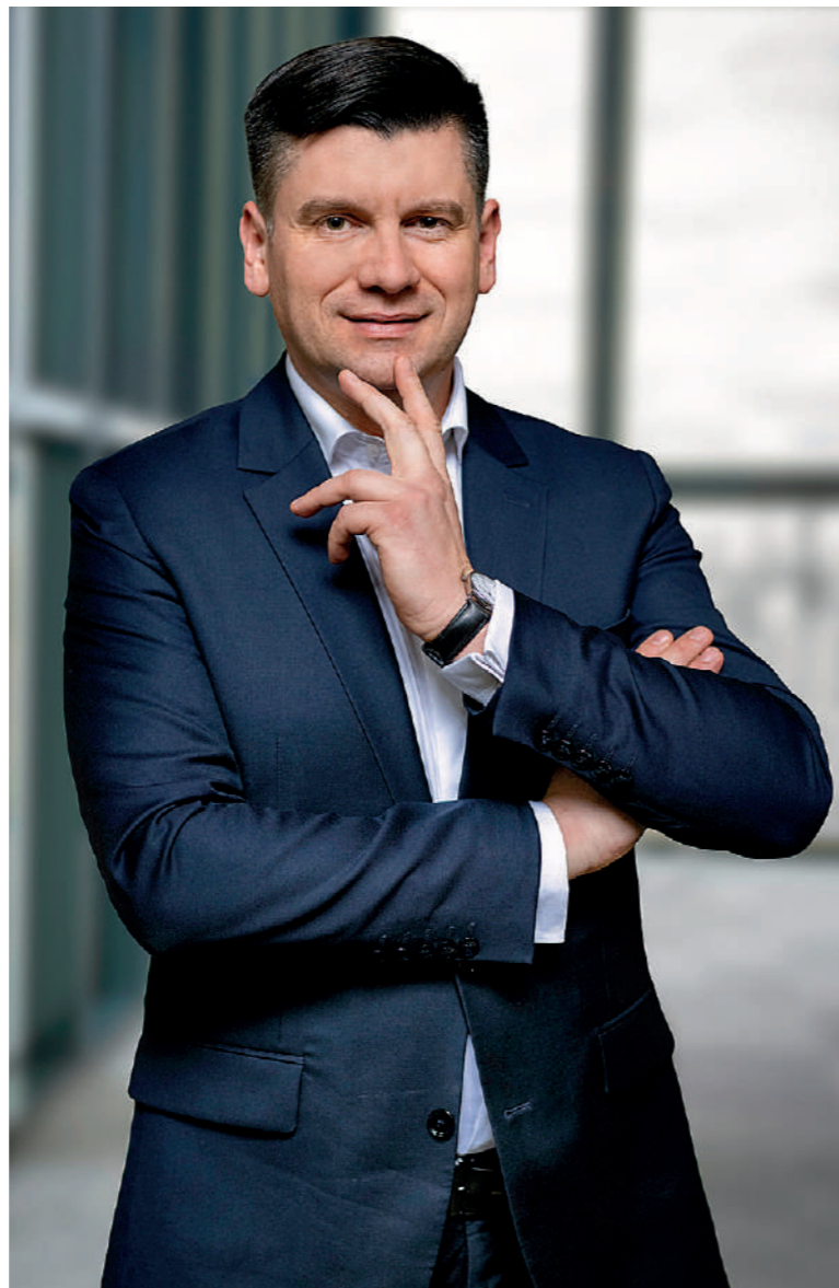
ŁUKASZ SMÓŁKA, marszałek Województwa Małopolskiego

– Podnoszenie innowacyjności regionu uważam za absolutny priorytet. Projektując strategię, analizowaliśmy wskaźnik intensywności prac badawczo-rozwojowych, czyli udział nakładów wewnętrznych na działalność badaw-