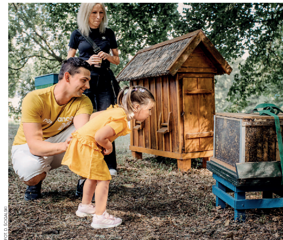
Piknik ogrodniczy podczas Dni Dziedzictwa przy pałacu Sanguszków w Tarnowie-Gumniskach

– To nie tylko bardzo miłe, to także kolejny powód do dumy dla całego zespołu Małopolskiego Instytutu Kultury. Aż 60 procent osób uczestniczących w Małopolskich Dniach Dziedzictwa Kulturowego co roku powraca z nami na te niezwykle ścieżki. Pewnie dlatego, że wiedzą, na co mogą liczyć, a także lubią tę formułę odkrywania tajemnic, zresztą my również ją lubimy. Układając program, obmyślając trasy, zawsze robimy to w taki