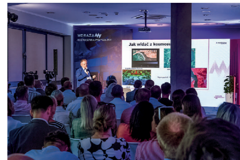
Podczas spotkania zaprezentowano również technologie powstałe dzięki eksploracji kosmosu

Rodzinną firmą Protech może być inspiracją, ponieważ dzięki odważnym decyzjom oraz inwestycjom w najnowsze technologie firma wykorzy-