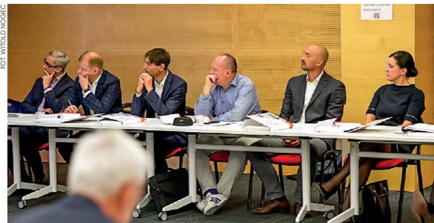
Inauguracyjne szkolenie odbyło się 10 czerwca 2024 r. w siedzibie Krakowskiego Parku Technologicznego

Liczymy, że widoczna od początku pozytywna energia, motywacja do działania i dobra współpraca zarówno partnerów, jak i uczestników, będzie owocować w kolejnych miesiącach. Razem udowadniamy, że Małopolska może rozwijać się szybko.