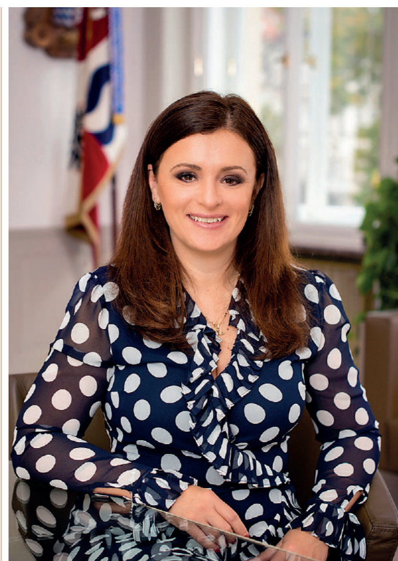
JAROSLAVA POKORNÁ JERMANOVÁ, przewodnicząca Komisji ECON Europejskiego Komitetu Regionów

- Jakie korzyści europejskie regiony mają z uzyskania tytułu ERP na dany rok?