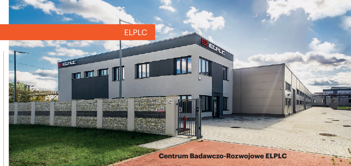
Centrum Badawczo-Rozwojowe ELPLC

ELPLC to lata doświadczeń nie tylko w sektorze automotive, ale również w wielu innych branżach przemysłu, takich jak: przemysł maszynowy, elektrotechniczny, elektroniczny, tworzyw sztucznych, cementowy czy chemiczny. Spółka współpracuje z wiodącymi