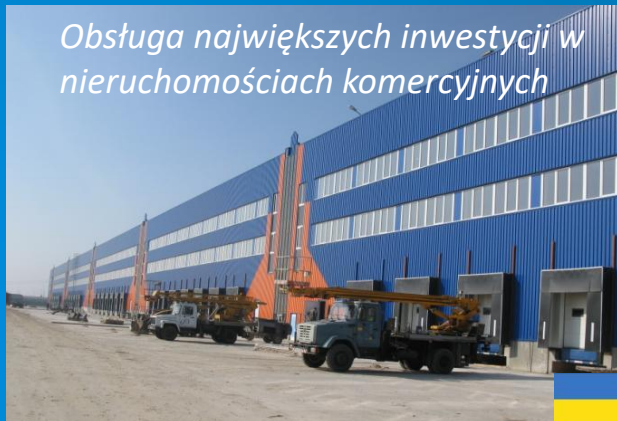
Obsługa największych inwestycji w nieruchomościach komercyjnych

DANYLO HALYTSKYI INTERNATIONAL AIRPORT "LVIV"